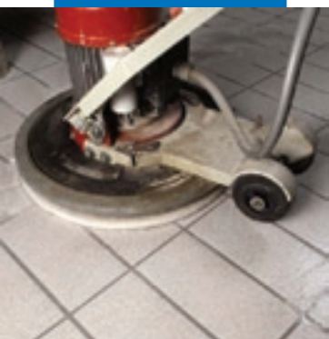
Очистка поверхности водой и дисковой машиной с абразивным падом, таким как "Scotch-Brite®"