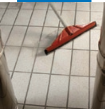
Удаление излишков воды резиновым скребком